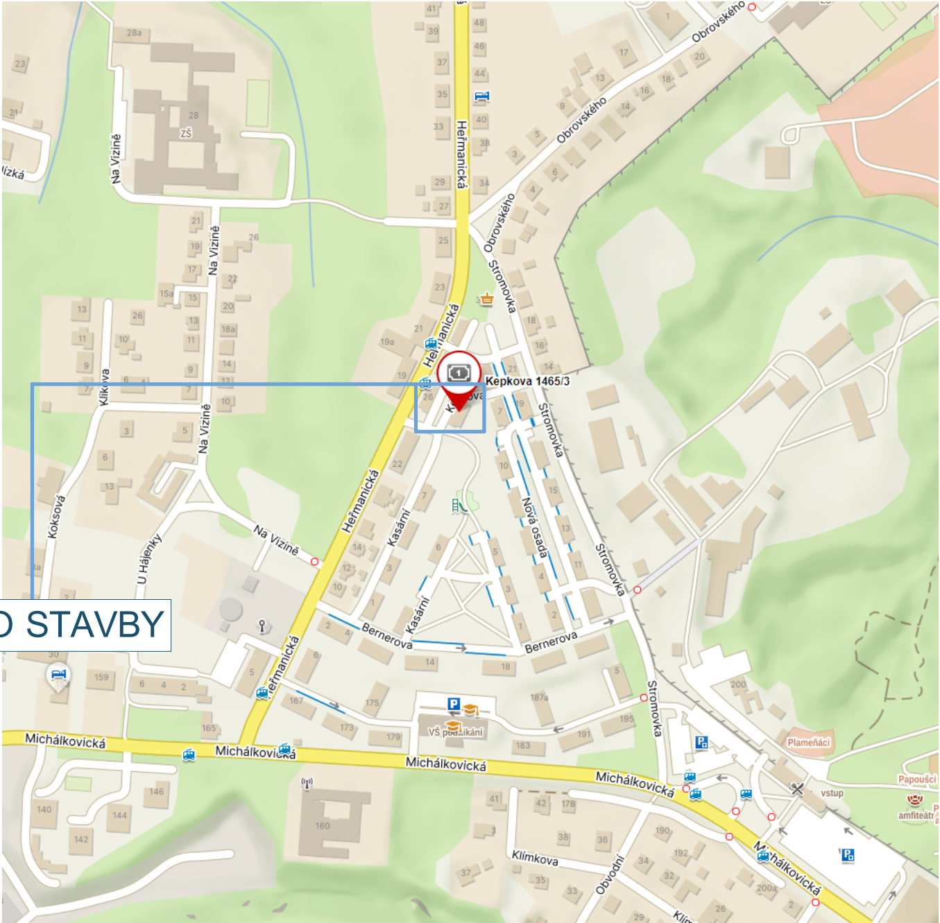
Situace - širší vztahy